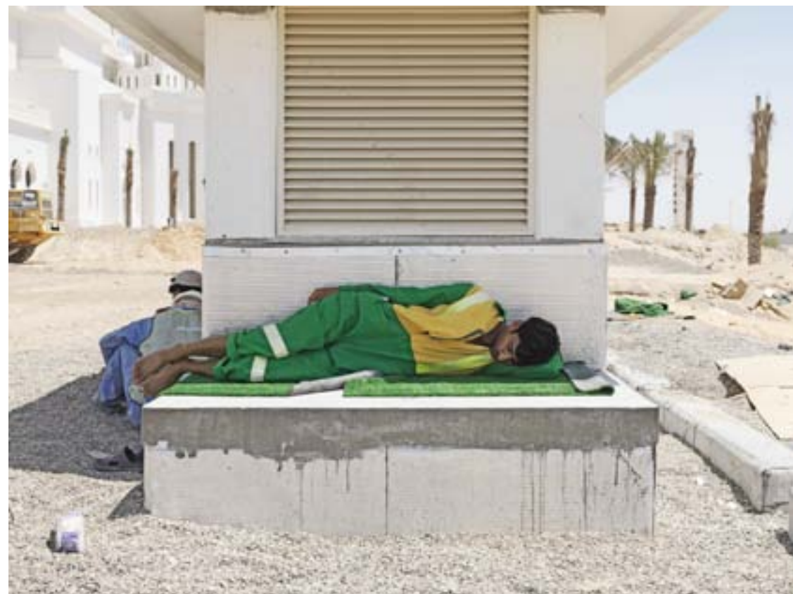
Emirates project, 2007-2011

Galerie Ikono, Bruxelles Workers Emirates