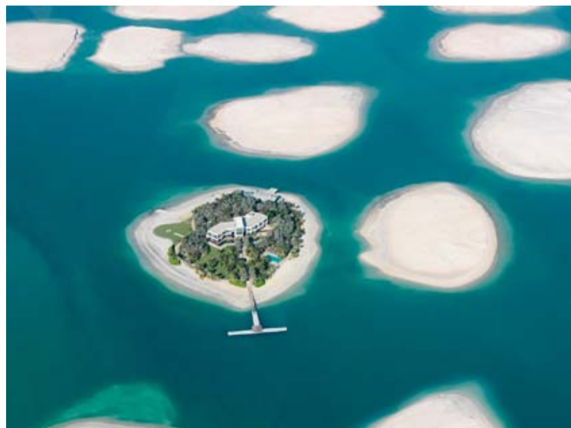
Emirates project, 2007-2011